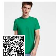
ATOMIC 150 CA6424