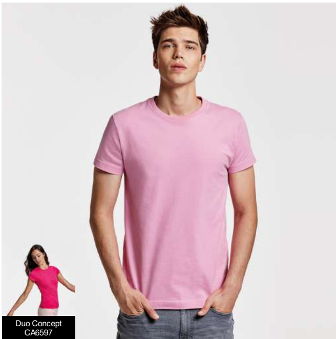
Duo Concept CA6597