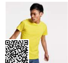
DOGO PREMIUM CA6502